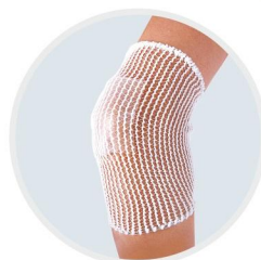
elastyczna siatka Codofix®

Właściwości adhezyjne opatrunku pozwalają na jego wielokrotne przyklejanie do powierzchni skóry. Przed każdym kolejnym zastosowaniem opatrunek musi być umyty.